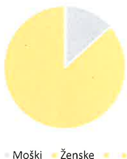
Število zaposlenih glede na spol

Posebno pozornost namenjamo vsem osebam, vključenim v naš delovni proces, pri čemer ne delamo razlik ali gre za zaposlene, upokojence, študente, ipd. Velik poudarek dajemo njihovi varnosti, zdravju, pogojem dela, socialni varnosti, osebnemu in strokovnemu razvoju, dialogu ter medsebojnim odnosom.